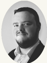
Lucas Pauchet TÉNOR